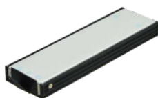
Быстросъемная корзина с SSD накопителем 256ГБ - 2ТБ PCIE