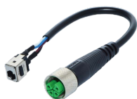
Адаптер кабеля питания