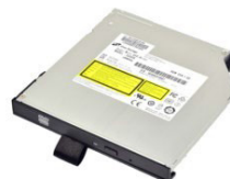
Съемный DVD Super Multi для медиа-отсека