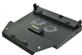
Док-станция для офиса с сетевым адаптером