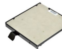
Съемный 3-й SSD- накопитель для медиа-отсека