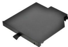
Съемная 2-я батарея для медиа-отсека