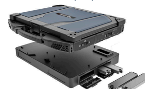
Блок расширения переносной сервер